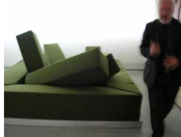
Rumble Sofa Édition Gufram 1967