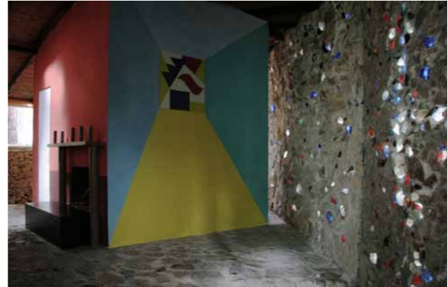
1-2. Maison Elba, extérieur et intérieur 1975-2011 3-4. Projet Archipensieri 2001-2011

Dans les décennies suivantes l'artiste poursuit une réflexion sur les relations entre l'art et l'architecture, notamment en explorant la notion de perception spatiale. Avec Archipensieri (Archipensées, 2001) il conçoit un projet en forme d'anamorphose, constitué d'éléments libres dans l'espace qui requièrent de la part du spectateur un parcours mental associé à une lecture plus attentive de l'espace qui les entoure. Une configuration inédite de ce projet sera réalisée pour la galerie, accompagnée de maquettes dessins et vidéos.