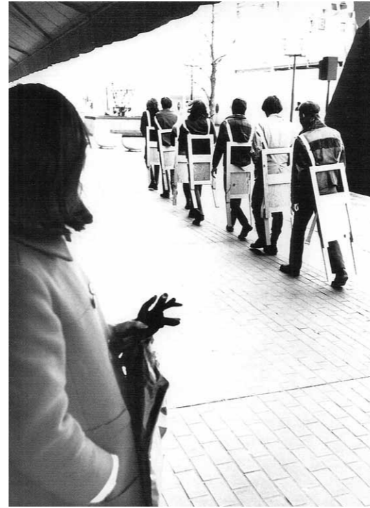
Wearable chairs 1971