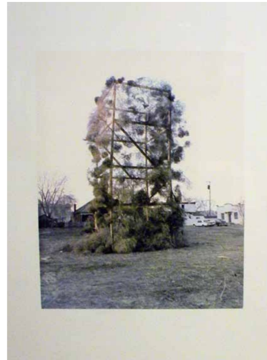
Tumbleweeds Catcher 1972