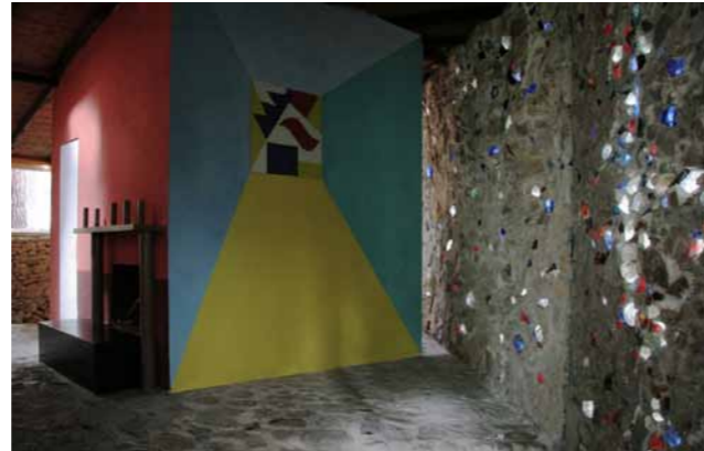
Maison Elba, extérieur et intérieur 1975-2011

Dans les décennies suivantes, l'artiste poursuit une réflexion sur les relations entre l'art et l'architecture, notamment en explorant la notion de perception spatiale. Avec Archipensieri ( Archipensées , 2001) il conçoit un projet en forme d'anamorphose, constitué d'éléments libres dans l'espace, qui requiert de la part du spectateur un parcours mental associé à une lecture plus attentive de l'environnement. Une configuration inédite de ce projet sera réalisée pour la galerie, accompagnée de maquettes, de dessins et de vidéos.