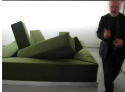
Rumble Sofa Édition Gufram 1967