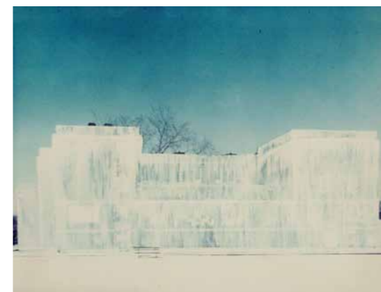
Ice House I 1971