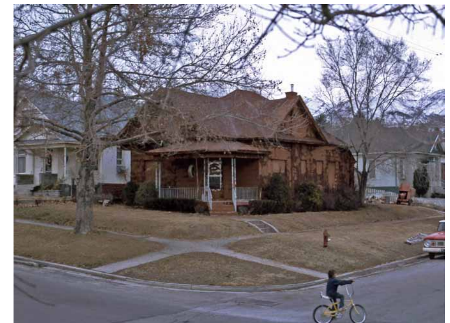
Clay House 1971

Avec le projet About non-conscious architecture ( A propos d'une architecture inconsciente , 1972-1973), Gianni Pettena s'interroge sur la place de l'homme dans l'espace apparemment vide des déserts. Vide qui n'est qu'une illusion, car il est constitué de monuments naturels qui dialoguent avec le contexte.